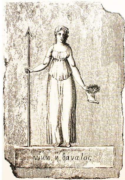
Το Μαρμάρινο Ανάγλυφο, με την επιγραφή “Νίκη ή Θάνατος” που δώρισαν οι Μανιάτες στον Ναπολέοντα.

Σχεδιασμός - Επιμέλεια - Εκτύπωση Εντύπων: Δήμος Ανατολικής Μάνης