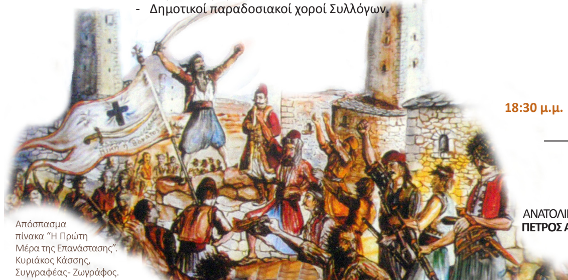
Απόσπασμα πίνακα "Η Πρώτη Μέρα της Επανάστασης". Κυριάκος Κάσης, Συγγραφέας - Ζωγράφος.