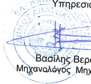
Βασίλης Βερούτης Μηχανολόγος Μηχανικός ΠΕ

Γύθειο 20-6-2022 Θεωρήθηκε Με εντολή Δημάρχου Ο Προϊστάμενος Τεχνικών Υπηρεσιών