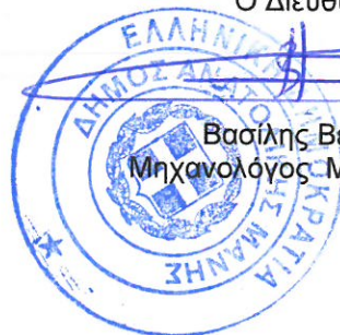
Βασίλης Βερούτης Μηχανολόγος Μηχανικός ΠΕ